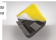
Fig. 3: Kit pre-assemblato + Kit Imbottitura