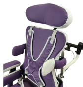
fig. 11: Bretellaggio

Usare sempre con cinghia pelvica per stabilizzare il bacino. Monitorare che l'utente non scivoli (rischio strangolamento).