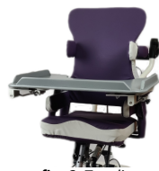
fig. 6: Tavolino

Il bloccaggio del tavolino avviene tramite inserimento del tondino guida nella relativa sede posta sotto l'appoggio e serraggio della manopola (fig. 6).