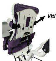
fig. 4: Regolazioni supporti toracici