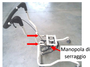
fig. 8: Telaio di base