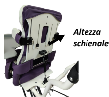
fig. 3: Regolazioni schienale

Lo schienale può essere reclinato agendo sulla leva di comando all'estremità inferiore della molla presente sul retro (fig. 5). Agendo su tale leva, la reclinazione è regolabile in maniera continua. Al rilascio della leva, la molla provvederà a bloccare lo schienale nella posizione raggiunta. Se si effettua la regolazione con l'utente finale, è necessario sostenere lo schienale fino al rilascio della leva. Eseguite questa operazione molto lentamente, in modo graduale e con la massima accortezza.