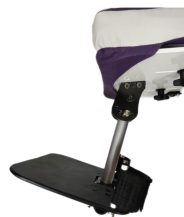
fig. 7: Pedana unica