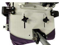
fig. 1: regolazione profondità seduta

Il sedile è un pezzo unico a forma anatomica posizionato sulla struttura metallica attraverso del sistema aggirante ad uncino. È possibile effettuare la regolazione in profondità per mezzo degli inserti di fissaggio presenti al di sotto della seduta (fig. 1); attraverso i fianchetti è possibile effettuare una regolazione in larghezza della seduta agendo sulle viti presenti al di sotto delle staffe come in figura 1. Inoltre, sia i fianchetti che i braccioli presentano una serie di fori che permettono diverse regolazioni tipo altezza, profondità inclinazione; basterà intervenire sulle viti presenti sui fianchetti (fig. 2).