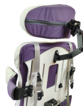
fig. 10: Poggiatesta

Il poggiatesta serve a dare sostegno al capo e a garantire uno sguardo orizzontale laddove possibile. È multiregolabile (fig. 10) ed è ancorato saldamente alla struttura; può essere regolato in altezza e profondità agendo sulle viti di fissaggio dei braccetti, mentre in angolazione agendo sulle viti della sede sferica del poggiatesta.