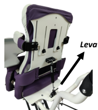
fig. 5: Regolazioni reclinazione

Assicurarsi del corretto funzionamento in sicurezza verificando: