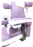
fig. 2: regolazione braccioli/fianchetti