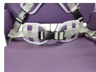
fig. 12: Cinghia pelvica

La cinghia pelvica (fig. 12) aiuta la stabilizzazione del bacino ostacolandone lo spostamento in avanti sul sedile e regolandone la posizione sul piano sagittale. La cinghia pelvica a due punti di fissaggio va ancorata nella parte inferiore della scocca sedile impegnando le viti di ancoraggio della piastra di inclinazione; se trattata di cinghia pelvica a 4 punti di fissaggio verrà ancorata sia a quelle viti che alle viti del kit fianchetti-bracciacoli. Qualsiasi cinghia pelvica scelta è dotata di pulsanti di sgancio di facile azionamento.