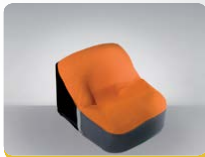
L' alternativa al guscetto