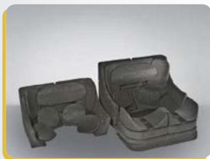
21 Insetti modulari modificabili