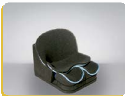
Imbottitura Forme Libere